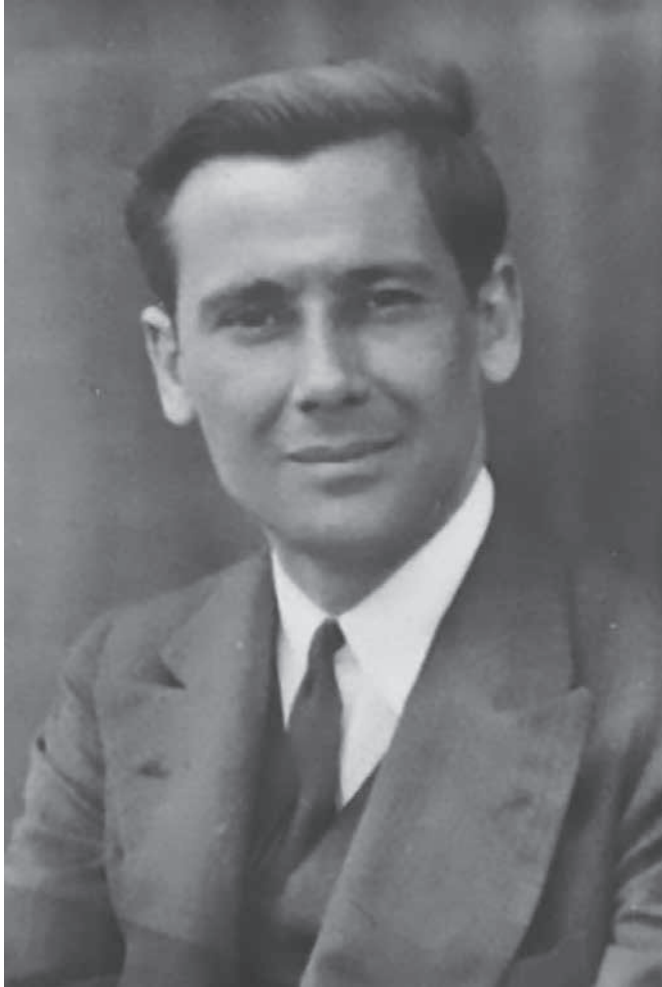
Santiago Montero Díaz Mugardos, A Coruña, 1911 – Madrid, 1985